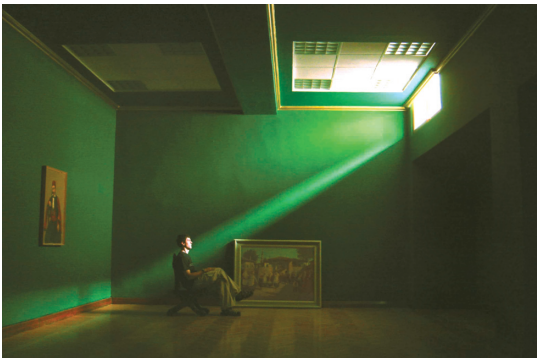
open space