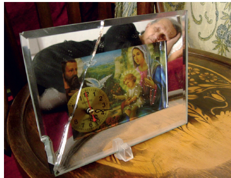
Living in a frame